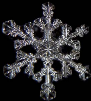
Objectif Sciences - Janvier 2007 - Station de montagne de Prabouré Type: P1h,i