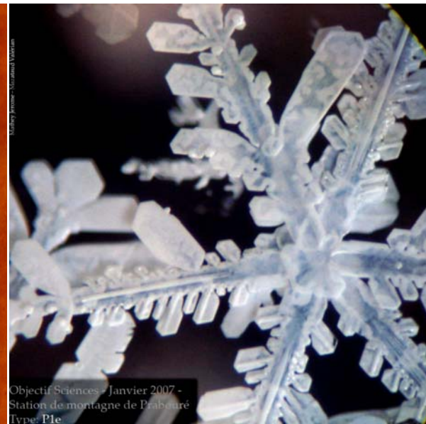
Objectif Sciences - Janvier 2007 - Station de montagne de Prabouré Type: P1e