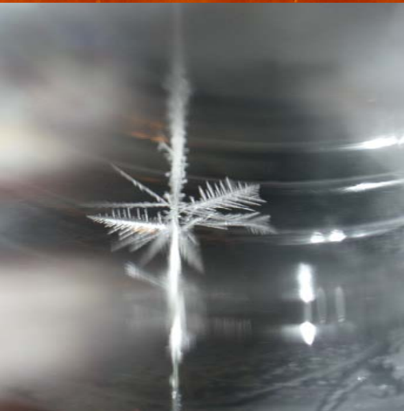
Objectif Sciences - Janvier 2007 - Station de montagne de Prabouré Type: P1b